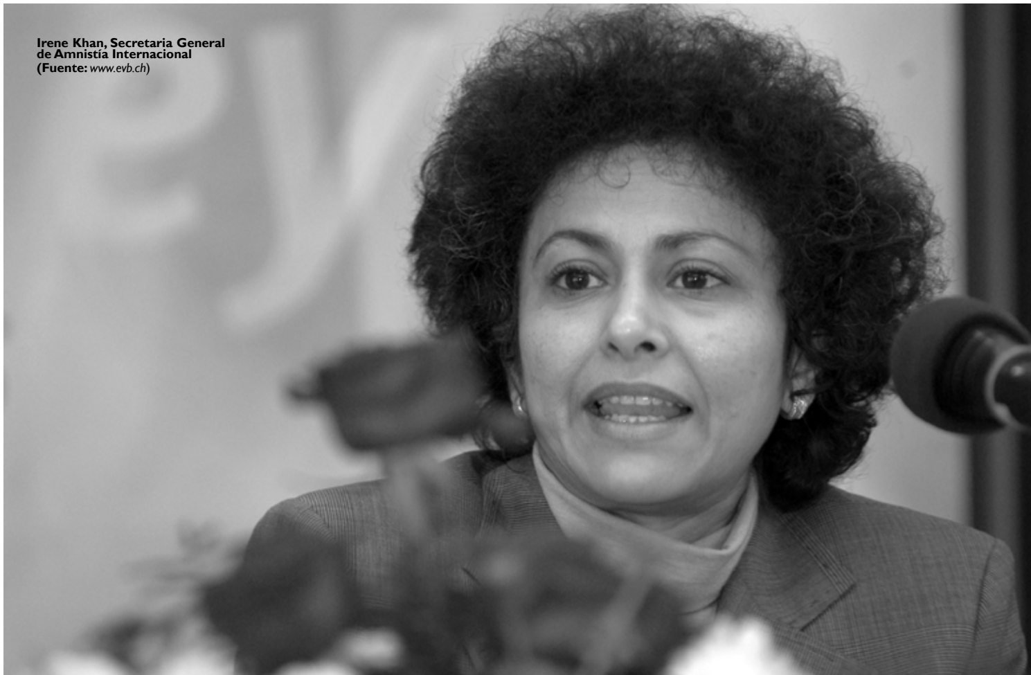
Irene Khan, Secretaria General de Amnistía Internacional

para la intercepción de llamadas, radares para rastrear embarques de drogas, aviones para transportar agentes mexicanos, así como varios programas de capacitación. Aunque aún no se hayan divulgado los detalles de un acuerdo bilateral de esta naturaleza, en virtud de los cuestionamientos al Plan Colombia, se teme que esta opción pueda implicar restricciones a los derechos humanos.