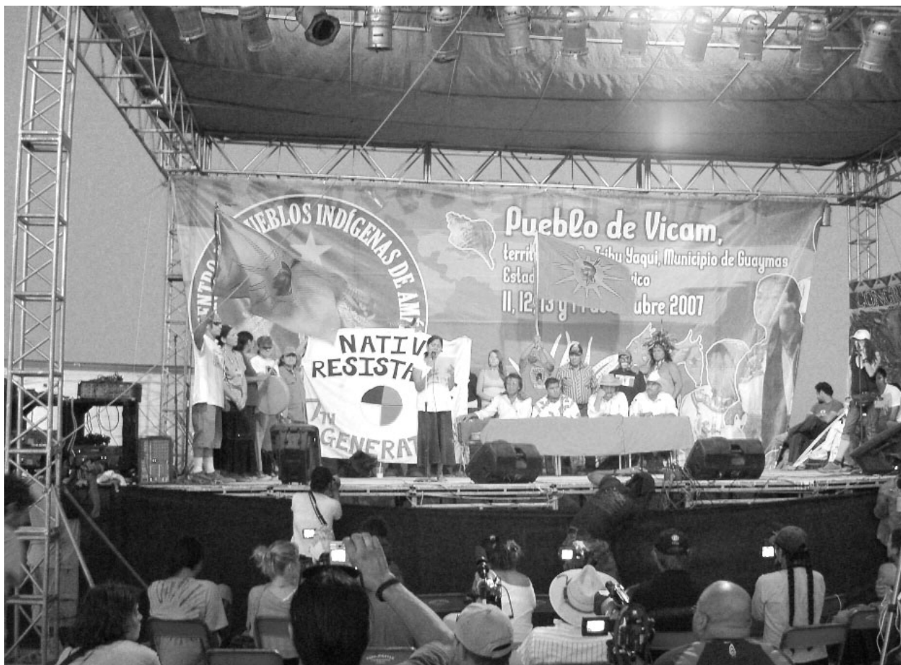
Encuentro de los Pueblos de América, Vicam, Sonora

el Encuentro. Algunas delegaciones participantes del evento también denunciaron que las policías y/o los soldados que los interceptaron en el camino los despojaron de los alimentos y granos que traían, y los trataron con hostilidad manifiesta. En las afueras de Vicam se mantuvo una vigilancia de la Policía Federal Preventiva y de la policía estatal de Sonora.