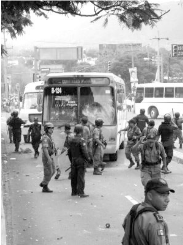
Policia y autobuses bloqueados en la calle