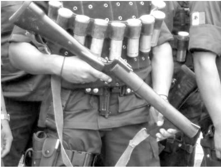
Policia con material antidisturbio

el Congreso, lo cual dará mayor estabilidad al gobierno de Ulises Ruiz para los próximos 3 años. Desde el lado de la protesta social, se teme que el gobierno pueda aprovechar esta situación para tomar venganza, asfixiando a las comunidades que se hayan rebelado contra el poder ejecutivo.