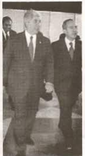
FRANCISCO RAMÍREZ Acuña y Felipe Calderón.